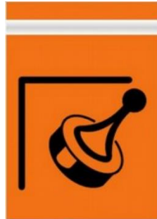
ZELFSTEMPELAAR EN BEMANDE CONTROLE